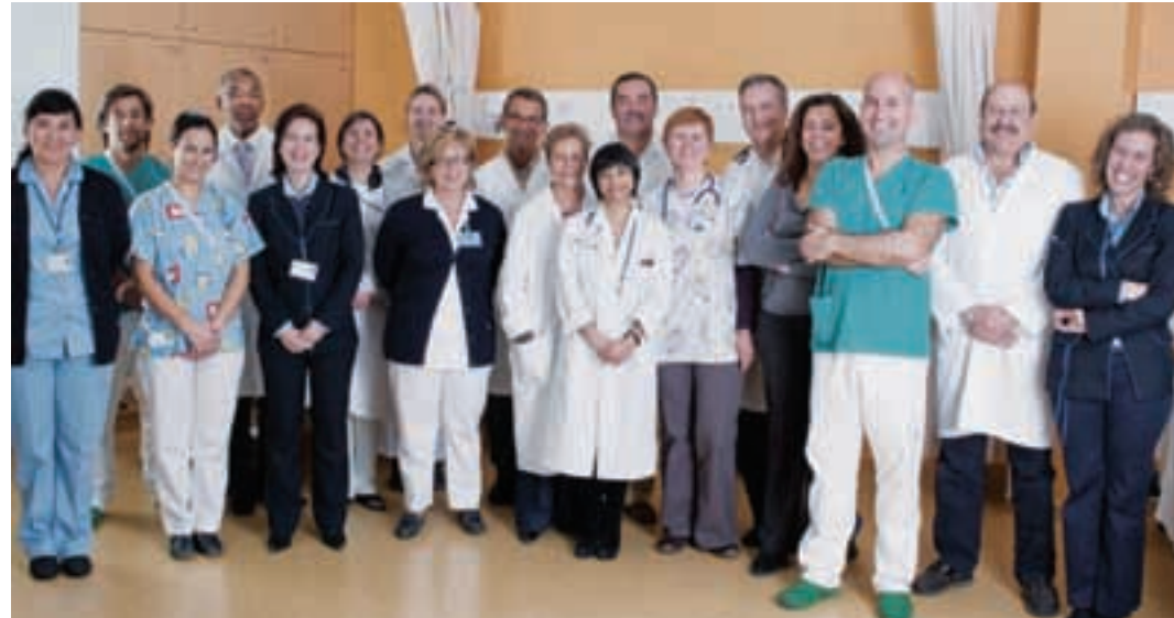
Equipa da ClínicaCuf Torres Vedras