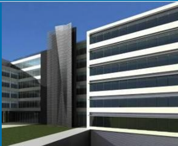
Novo Hospital de Braga