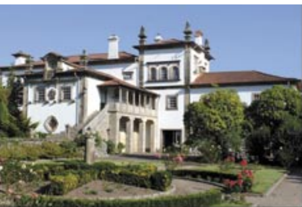
QUINTA DO CONVENTO DE VAL DE PEREIRAS Ponte de Lima · Portugal

Sempre com o objectivo de promover a dignidade e qualidade de vida das pessoas com uma idade mais avançada, a José de Mello Residências e Serviços oferece soluções desenhadas para as necessidades reais daqueles que tanto precisam de atenção e cuidados, mas cuja vida querem ver enriquecida.